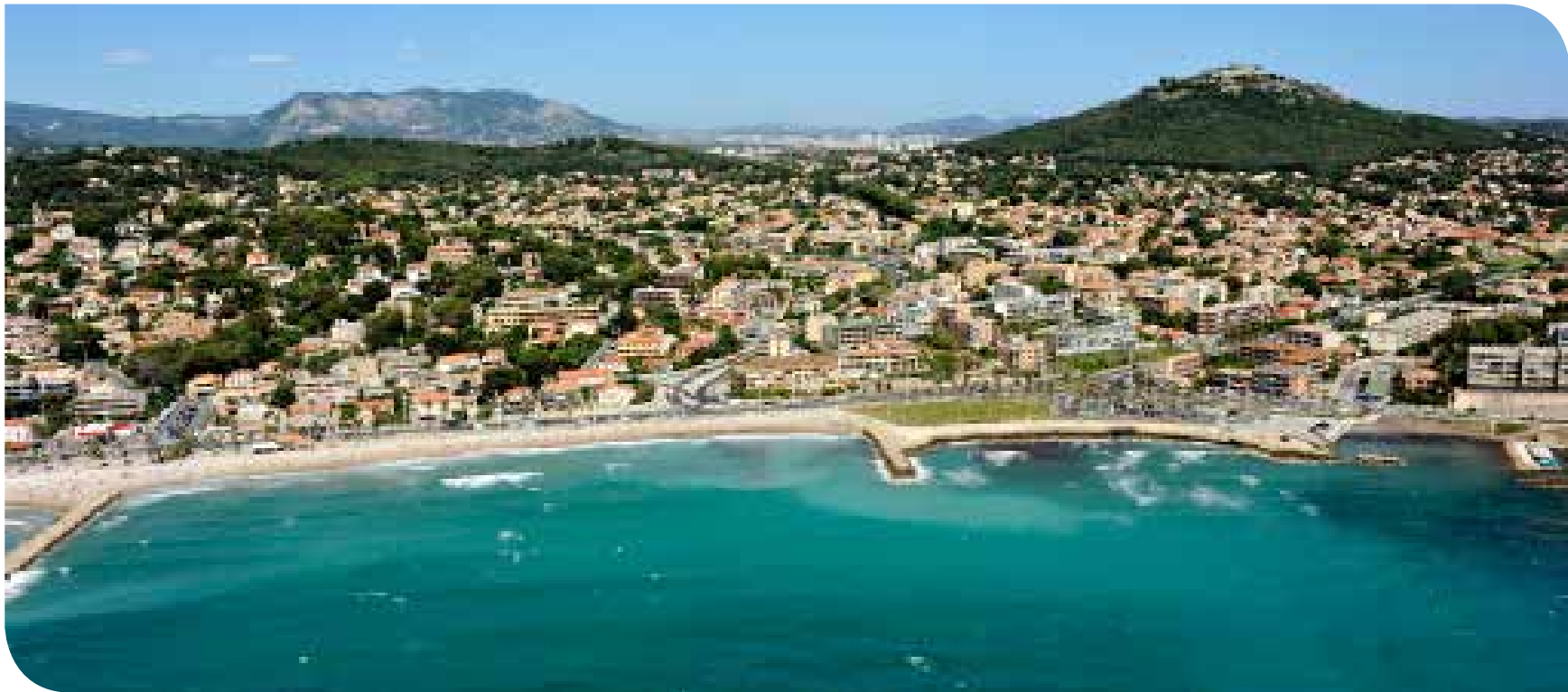
Six-Fours-Les-Plages, le littoral vu du ciel