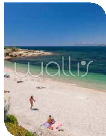
Plage de la Coudoulière