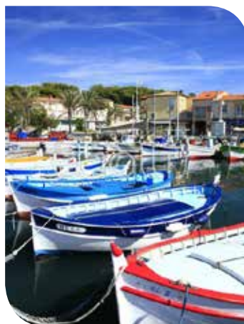
Port du Brusc

Six-Fours-les Plages, la ville côté nature... Massif forestier du Mont Salva, Île des Embiez, Presqu'île du Gaou, Cap Sicié, Port du Brusc... autant d'invitations à la douceur de vivre.