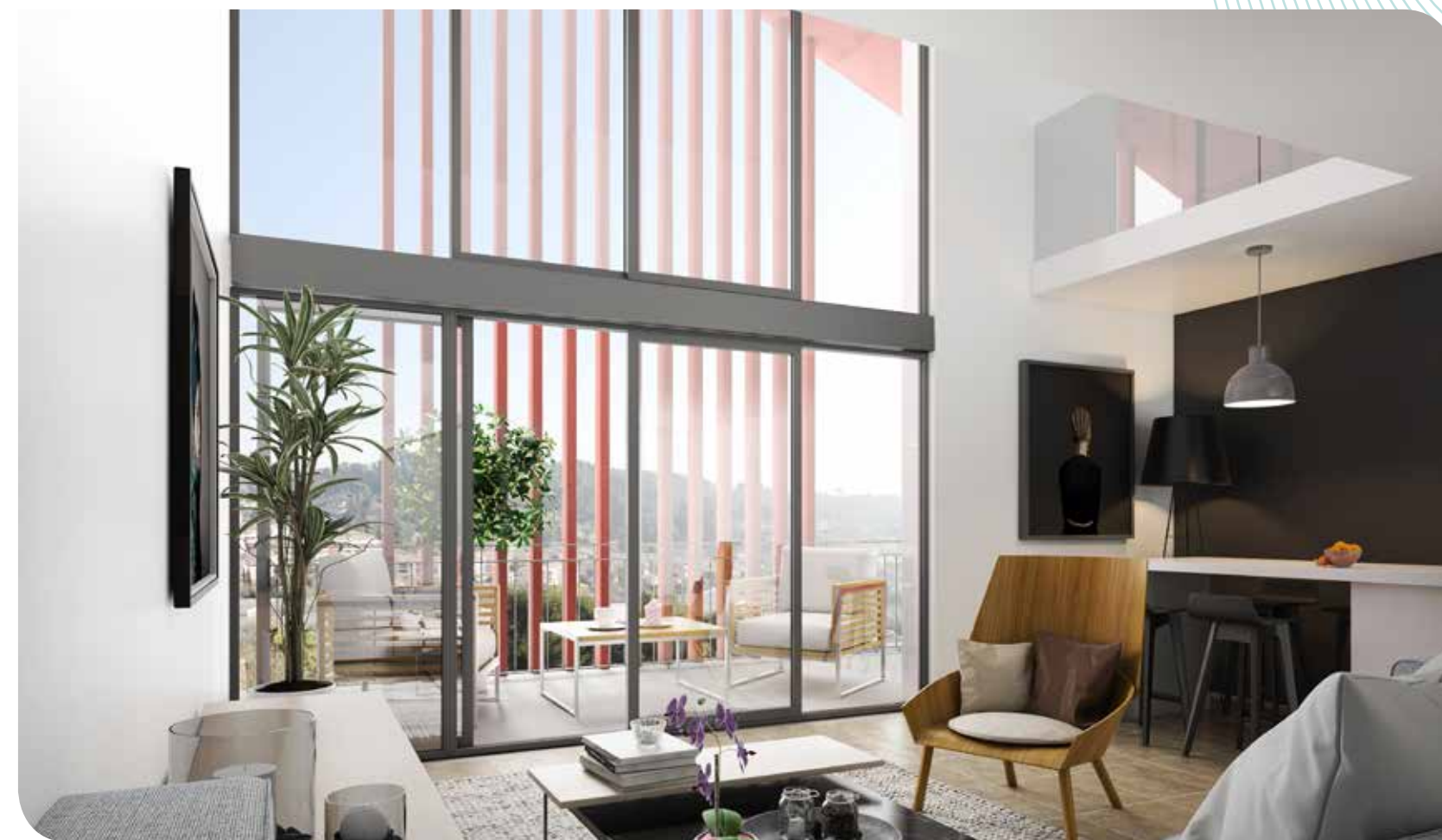
Intérieur d'une villa duplex