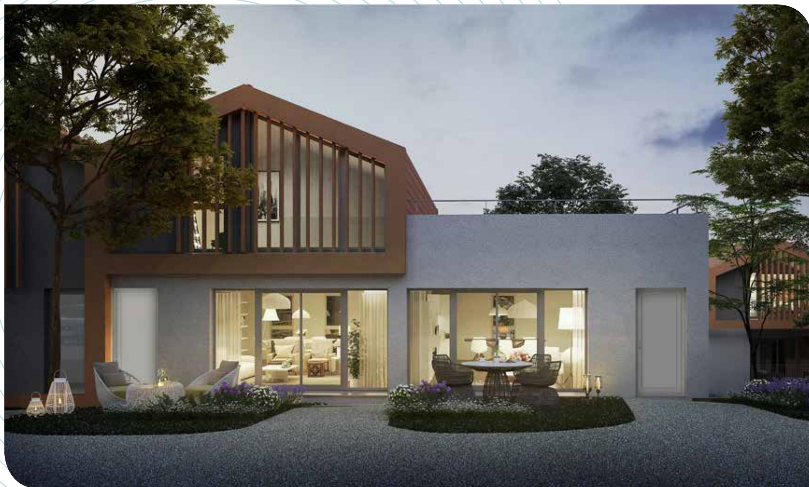
Villa duplex avec jardin

Imme Sagemuller – Architecte concepteur de la résidence Grand R