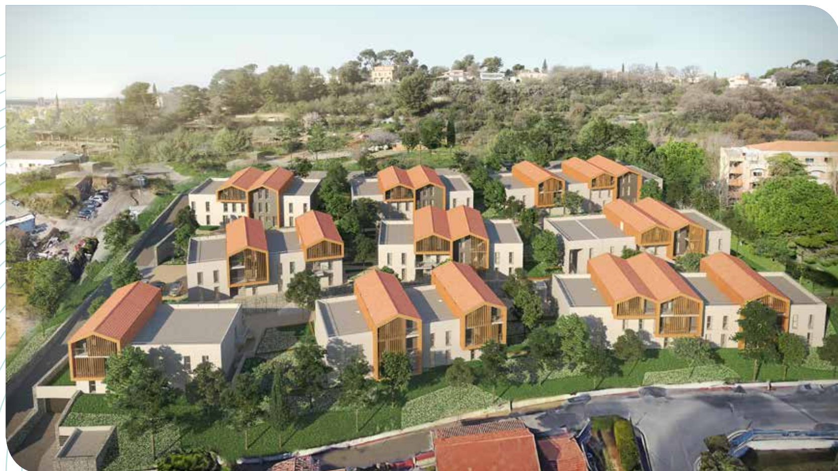
Vue de la résidence depuis le chemin des Anémones

P rojet audacieux à la fois directement accessible par le chemin des Anémones en lisière d'un bois, Grand R est un programme harmonieux composé de villas et d'appartements allant du 2 au 5 pièces. Se jouant de la topographie faite de restanques, la résidence s'inscrit dans son environnement immédiat en réaménageant les espaces verts et les mails piétonniers paysagers.