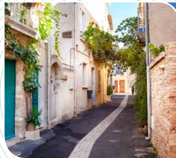
Ruelle de Saint-Julien

Programme résolument contemporain à l'esprit très nature, en phase avec les attentes actuelles en termes de mobilité, d'accessibilité et de qualité, Grand R est une nouvelle définition de l'habitat, à mi-chemin entre la quiétude offerte par son parc boisé, la convivialité à "l'esprit village" et le confort résidentiel des programmes modernes.