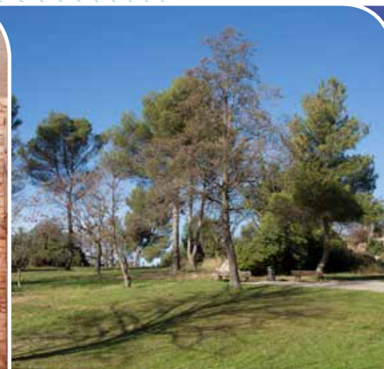
Parc de la Mirabelle