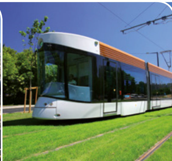
Tramway avenue William Booth