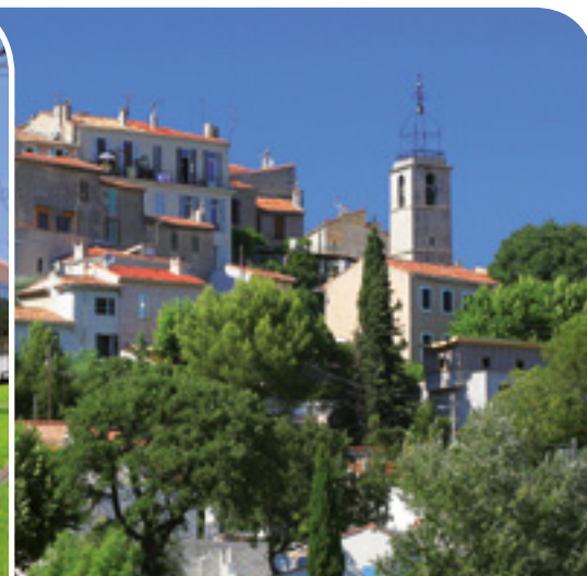
Village de St Julien