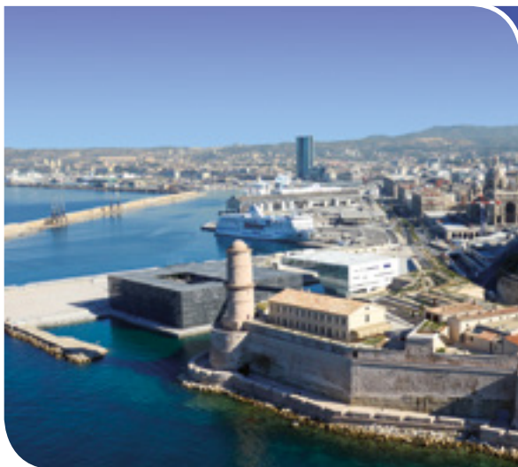
De la Joliette au Fort St Jean

Vous serez charmés par le vieux village préservé avec ses ruelles, son église et sa petite place bordée de platanes centenaires.