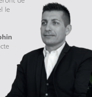
Nicolas Mulphin Architecte

Les matériaux nobles employés tels que la pierre et le verre, ainsi que les espaces de respiration, composés d'un volet paysager finement étudié, feront de Palm Horizon un écrin dans lequel le « bon vivre » sera de rigueur.