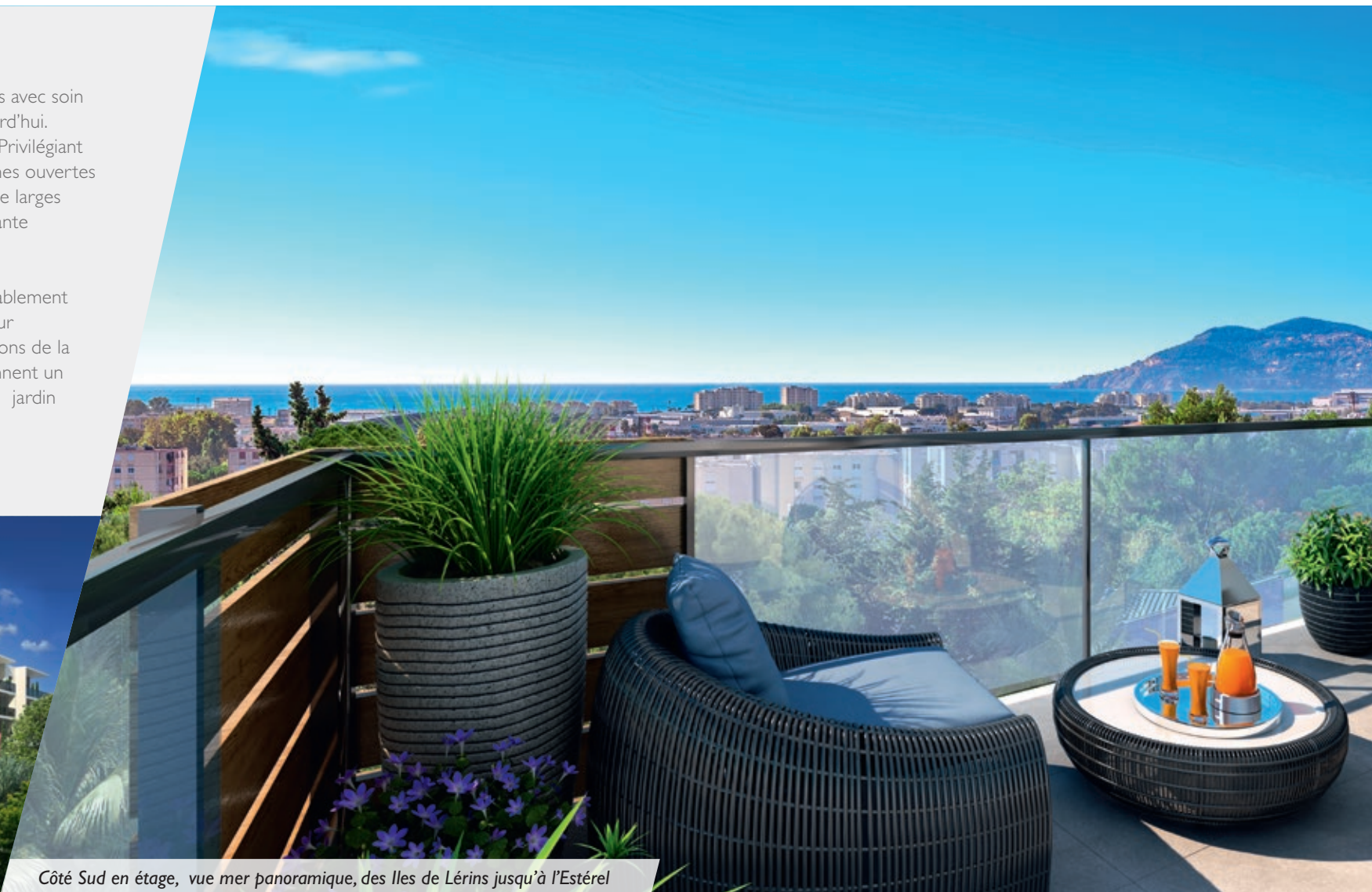
Côte Sud en étage, vue mer panoramique, des Iles de Lérins jusqu'à l'Estérel