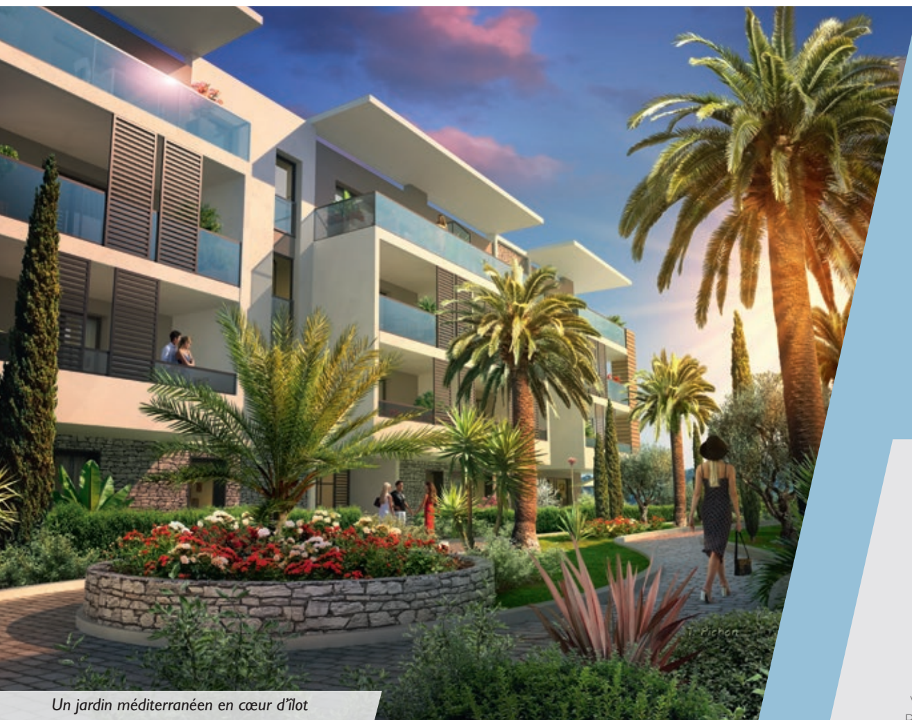
Un jardin méditerranéen en cœur d'îlot