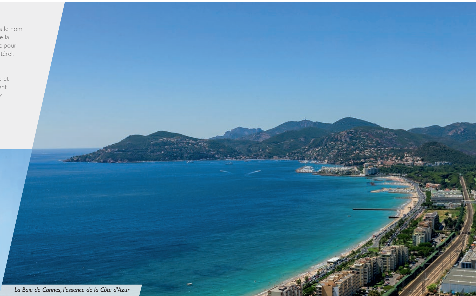
La Baie de Cannes, l'essence de la Côte d'Azur

Une adresse de valeur au calme d'un quartier résidentiel alliant les plaisirs de la Côte d'Azur et toutes les commodités du quotidien