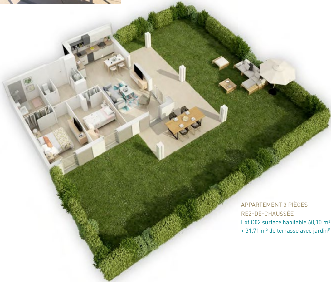
APPARTEMENT 3 PIÈCES REZ-DE-CHAUSSÉE Lot C02 surface habitable 60,10 m 2 + 31,71 m 2 de terrasse avec jardin (1)