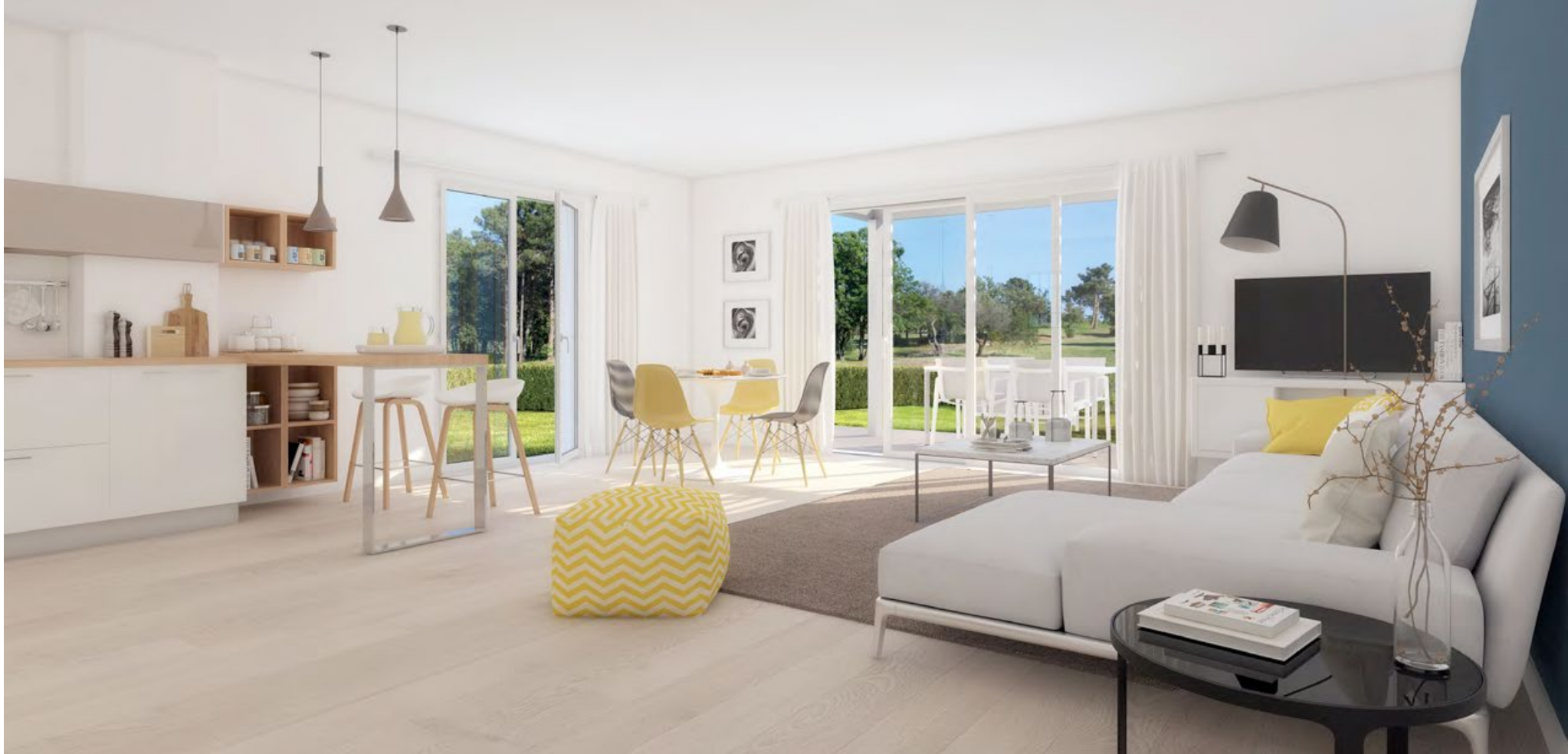
Vue intérieure d'une maison 4 pièces (lot M15.1 (1) )