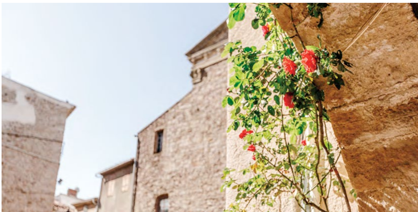
Un patrimoine remarquable : l'église gothique, le Castrum, la Tour de l'Horloge.