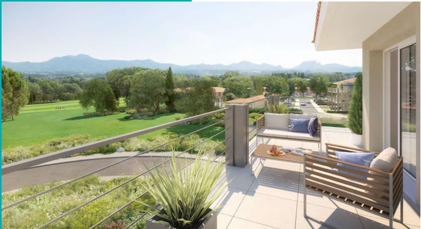
Vue d'une terrasse (appartement lot D23 (1) )