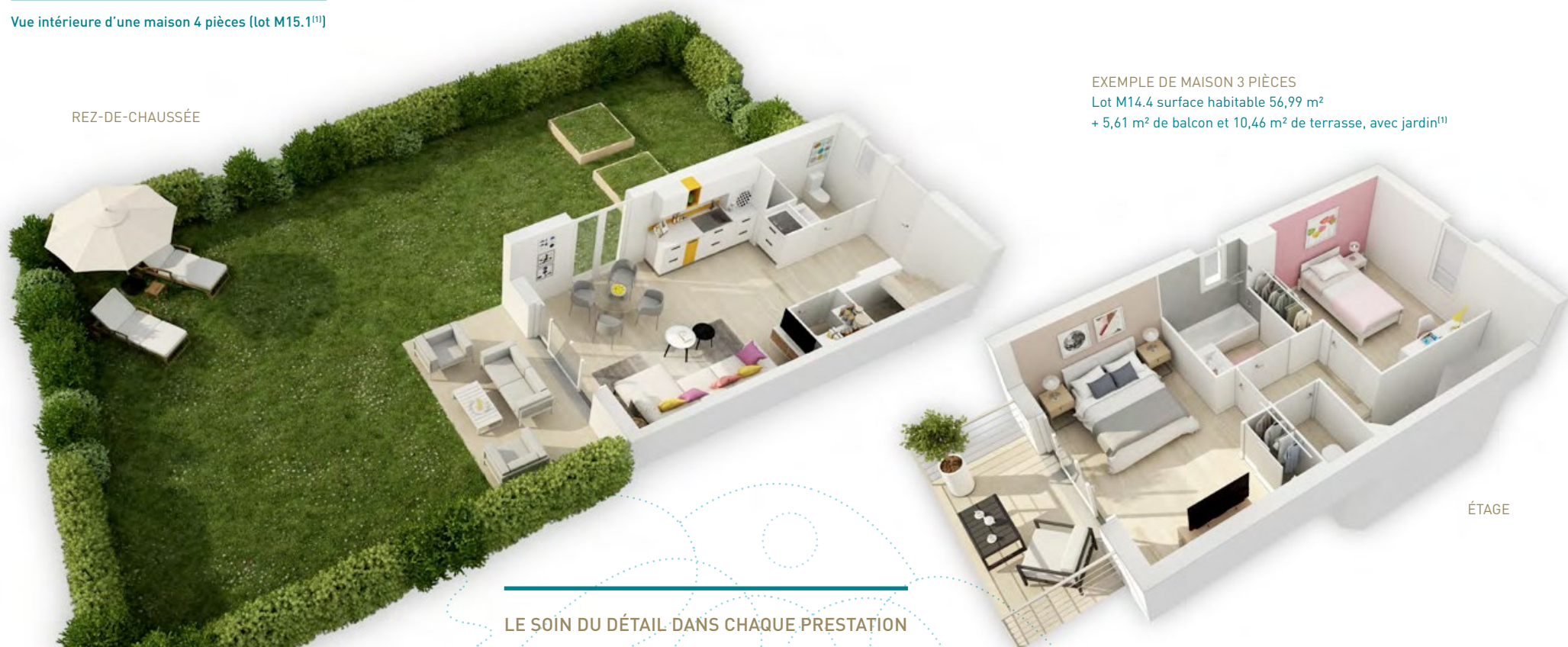
EXEMPLE DE MAISON 3 PIÈCES Lot M14.4 surface habitable 56,99 m 2 + 5,61 m 2 de balcon et 10,46 m 2 de terrasse, avec jardin (1)