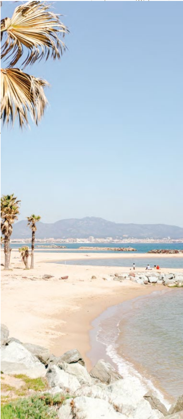
Un littoral bordé de plages de sable fin.