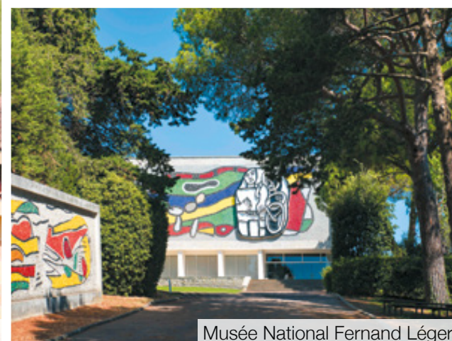
Musée National Fernand Léger