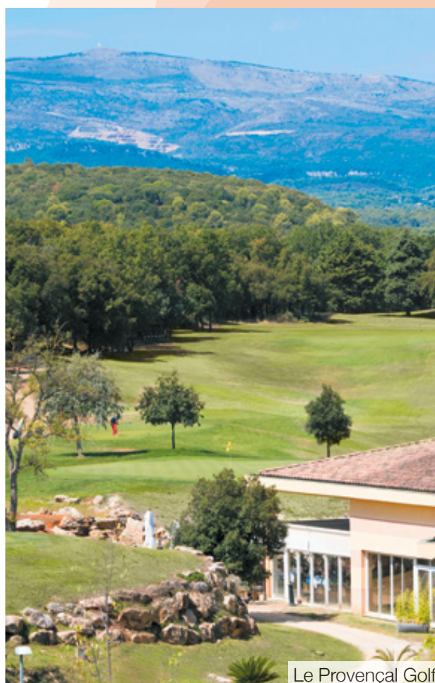
Le Provençal Golf