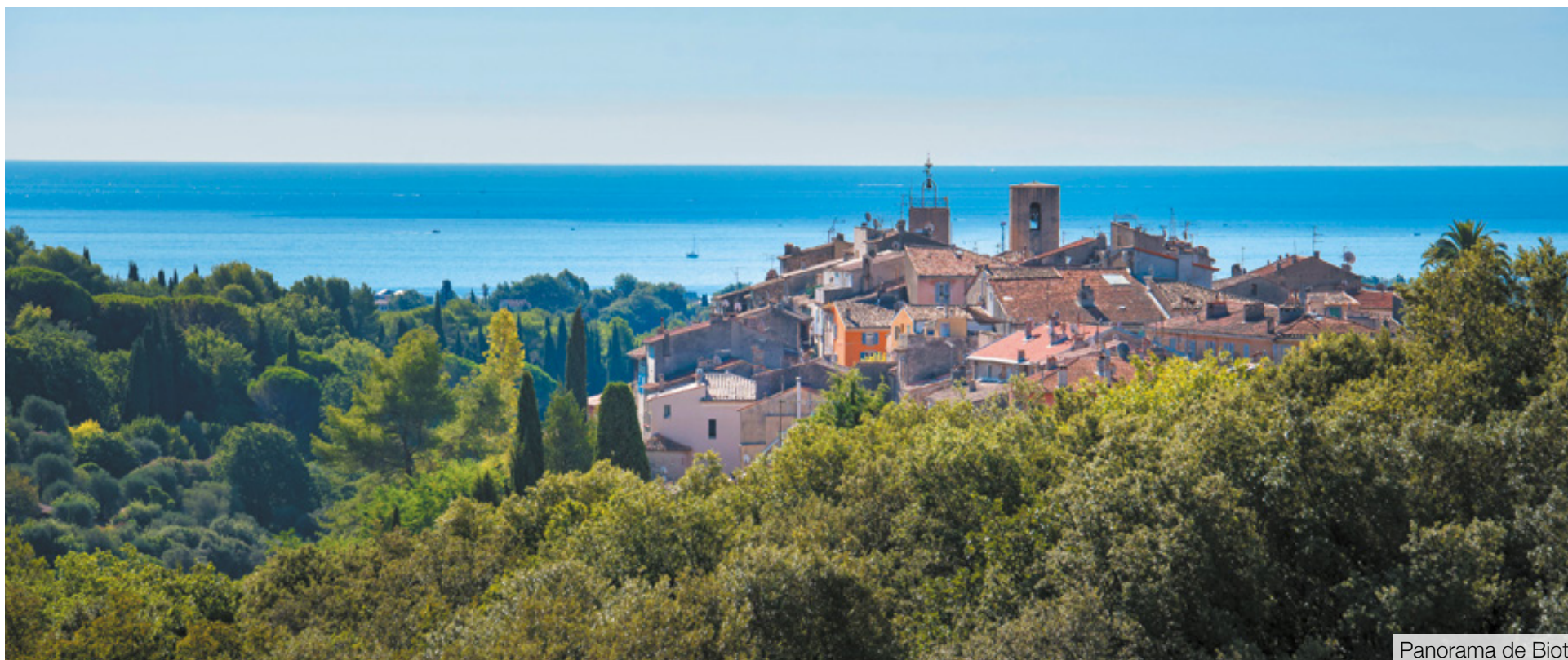
Panorama de Biot