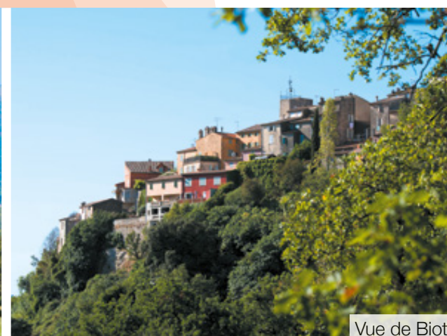
Vue de Biot