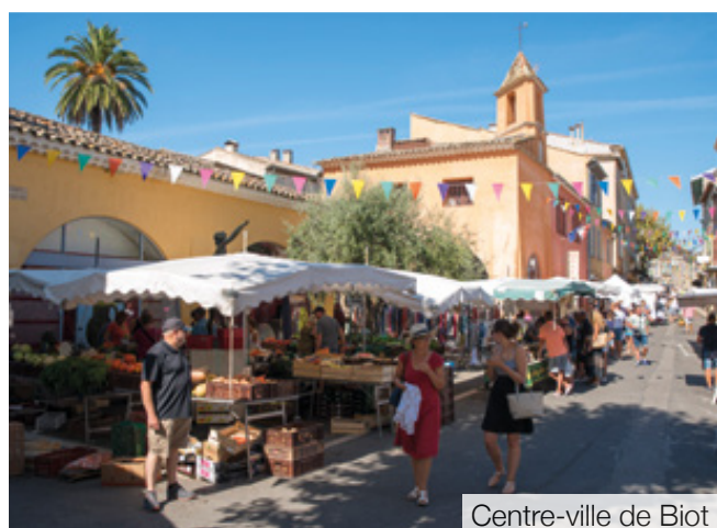
Centre-ville de Biot