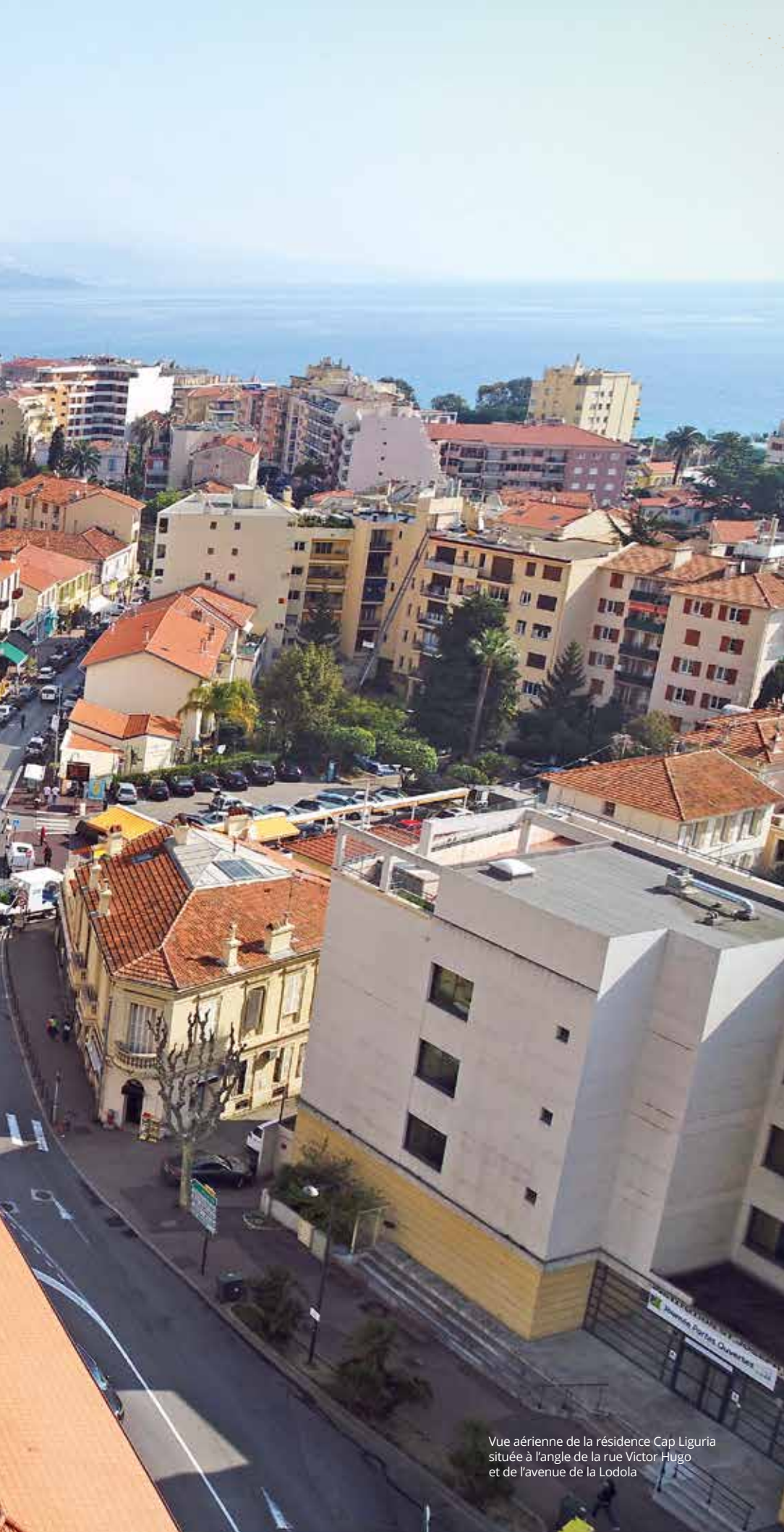
Vue aérienne de la résidence Cap Liguria située à l'angle de la rue Victor Hugo et de l'avenue de la Lodola