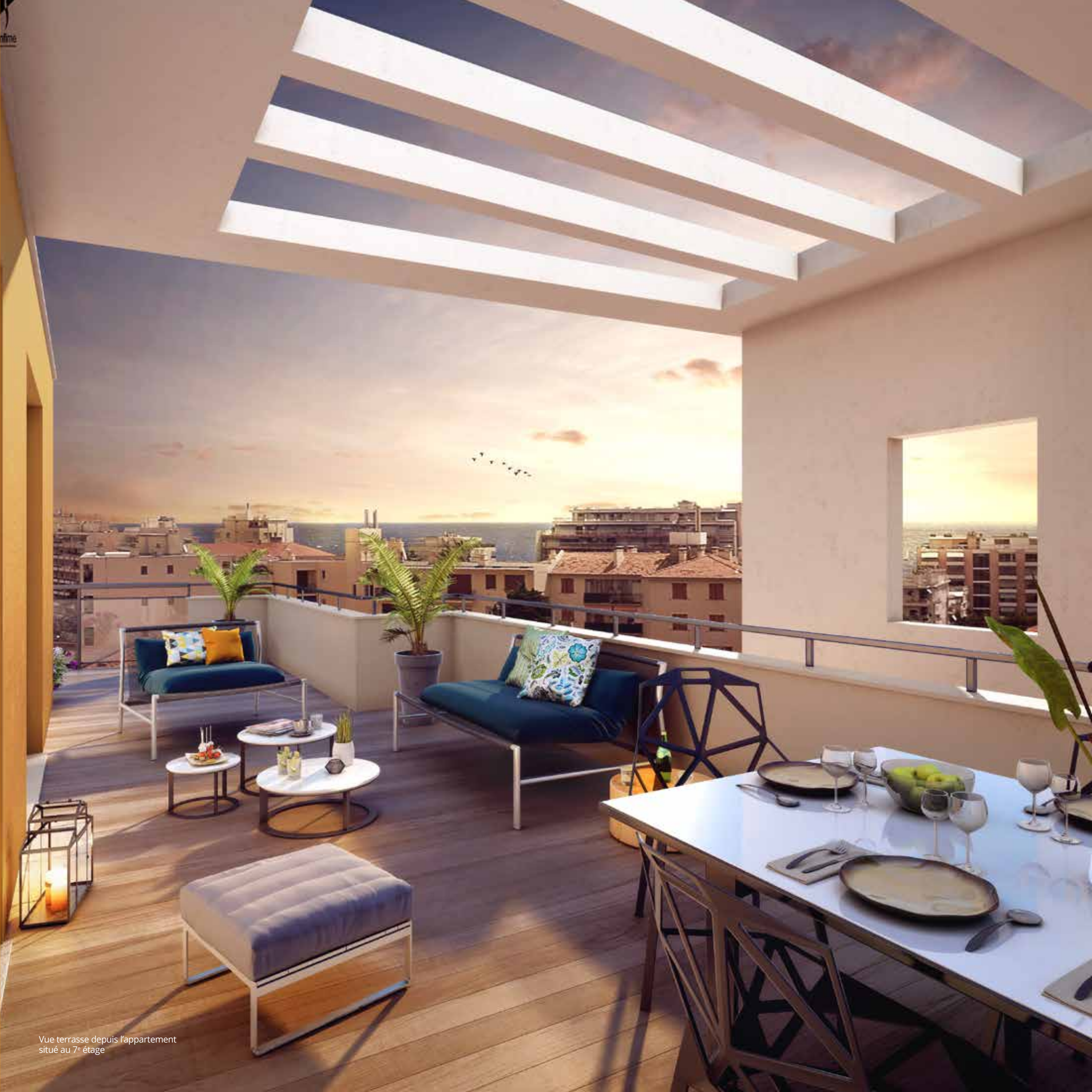
Vue terrasse depuis l'appartement situé au 7 e étage