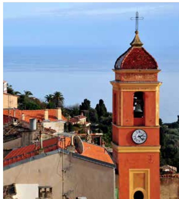
Église de Roquebrune