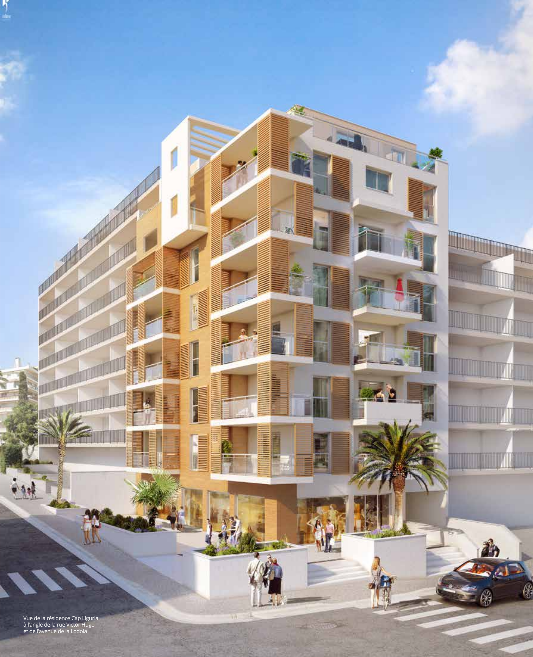
Vue de la résidence Cap Liguria à l'angle de la rue Victor Hugo et de l'avenue de la Lodola