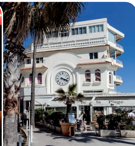
Boulevard Edouard Baudoin