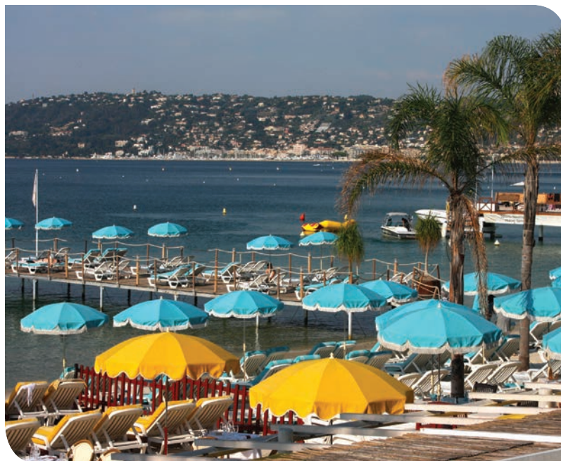
Plage de Juan-les-Pins

Une vie agréable vous attend à Villa Galice, en toute quiétude.