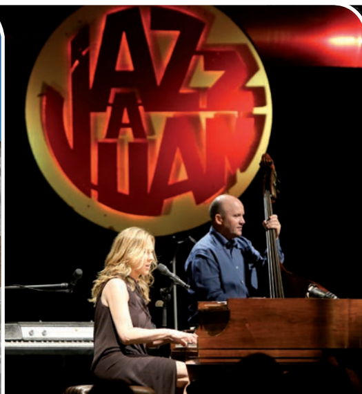
Festival Jazz à Juan