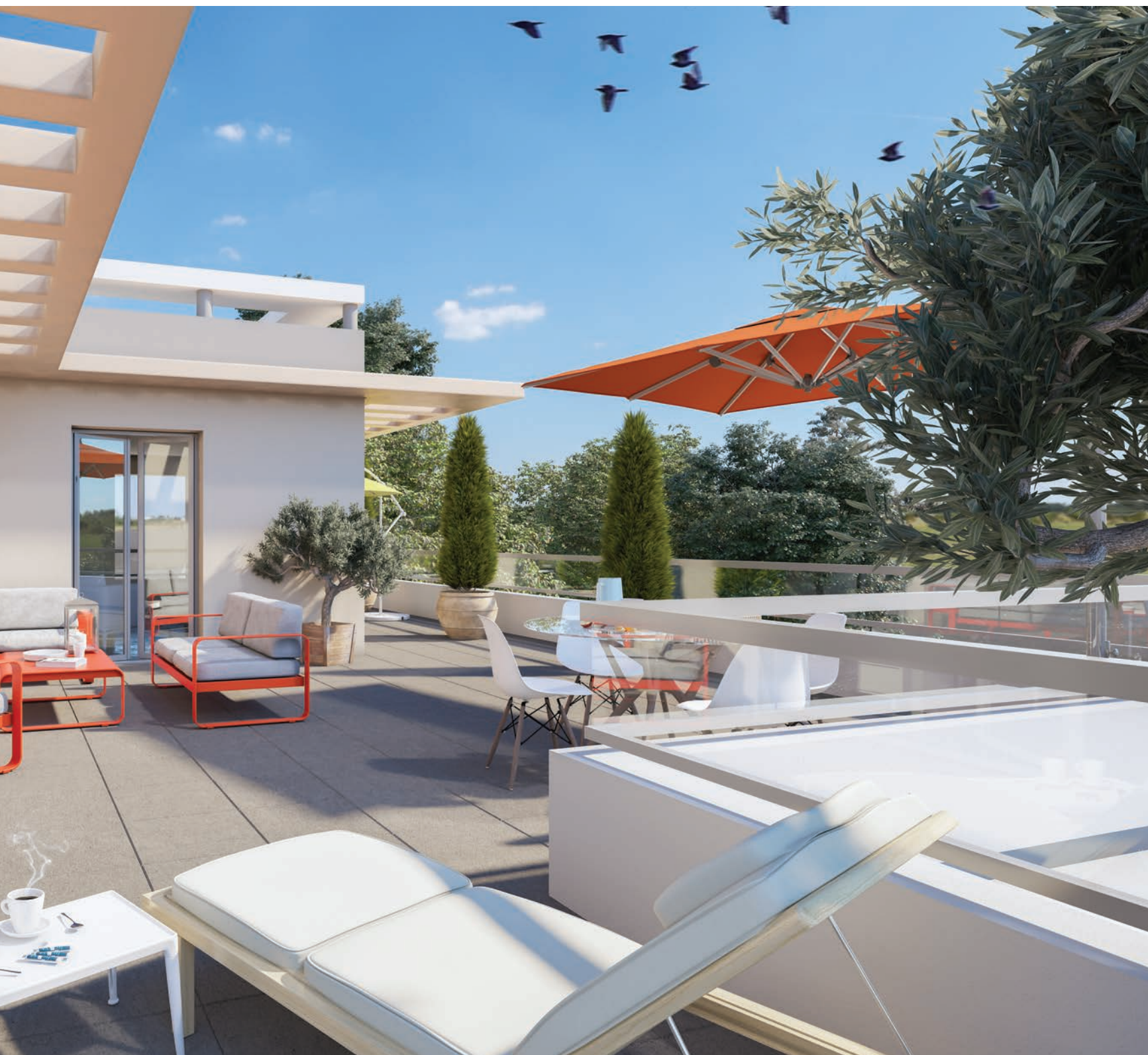
Appartement avec terrasse