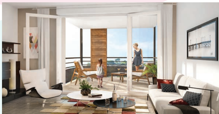
Appartement avec terrasse Résidence Clos Eden au Cannet