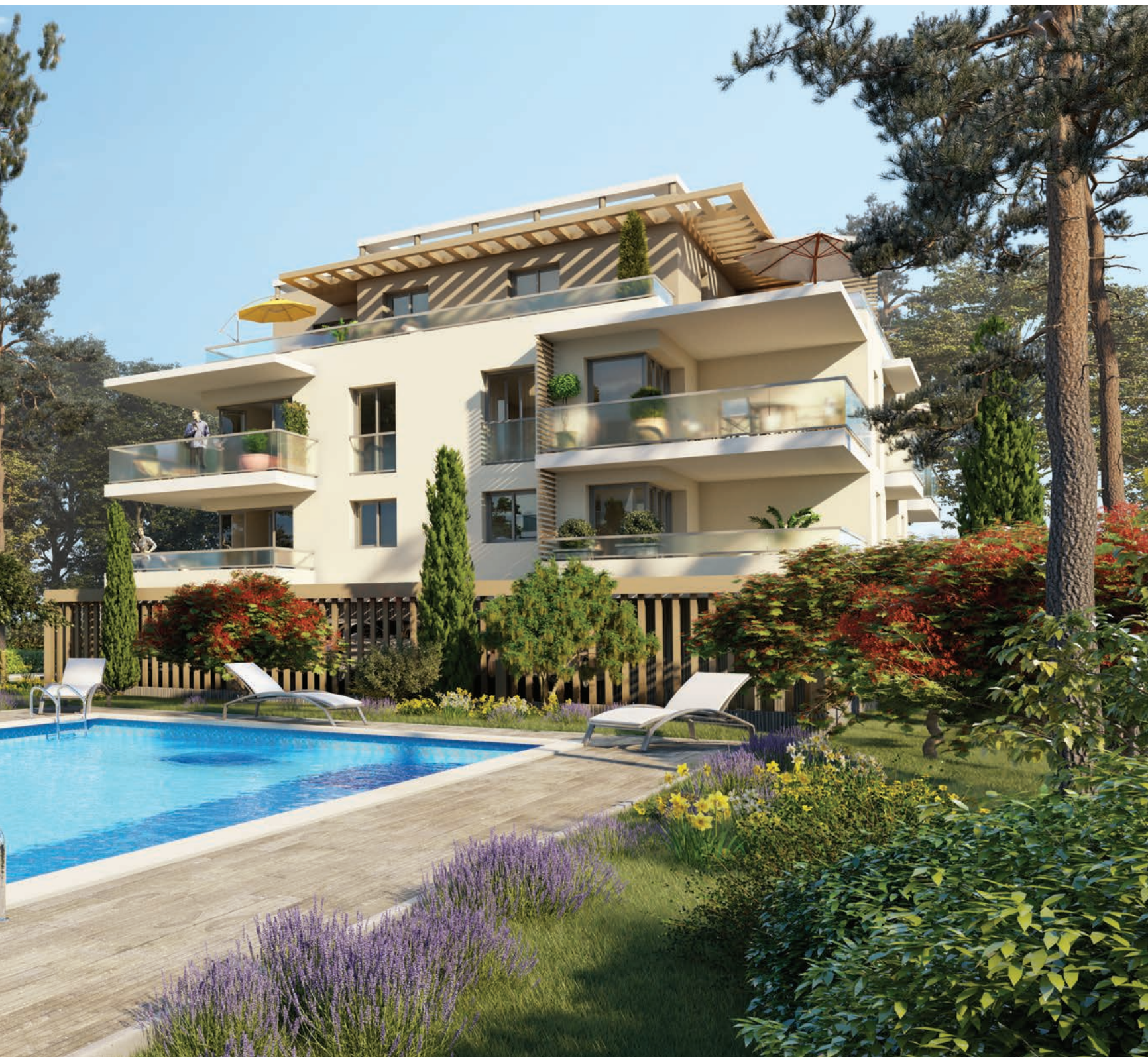
Vue générale depuis les jardins