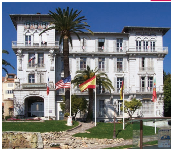
Mairie du Cannel

présente tous les atouts pour une vie agréable et facilitée au Cannel