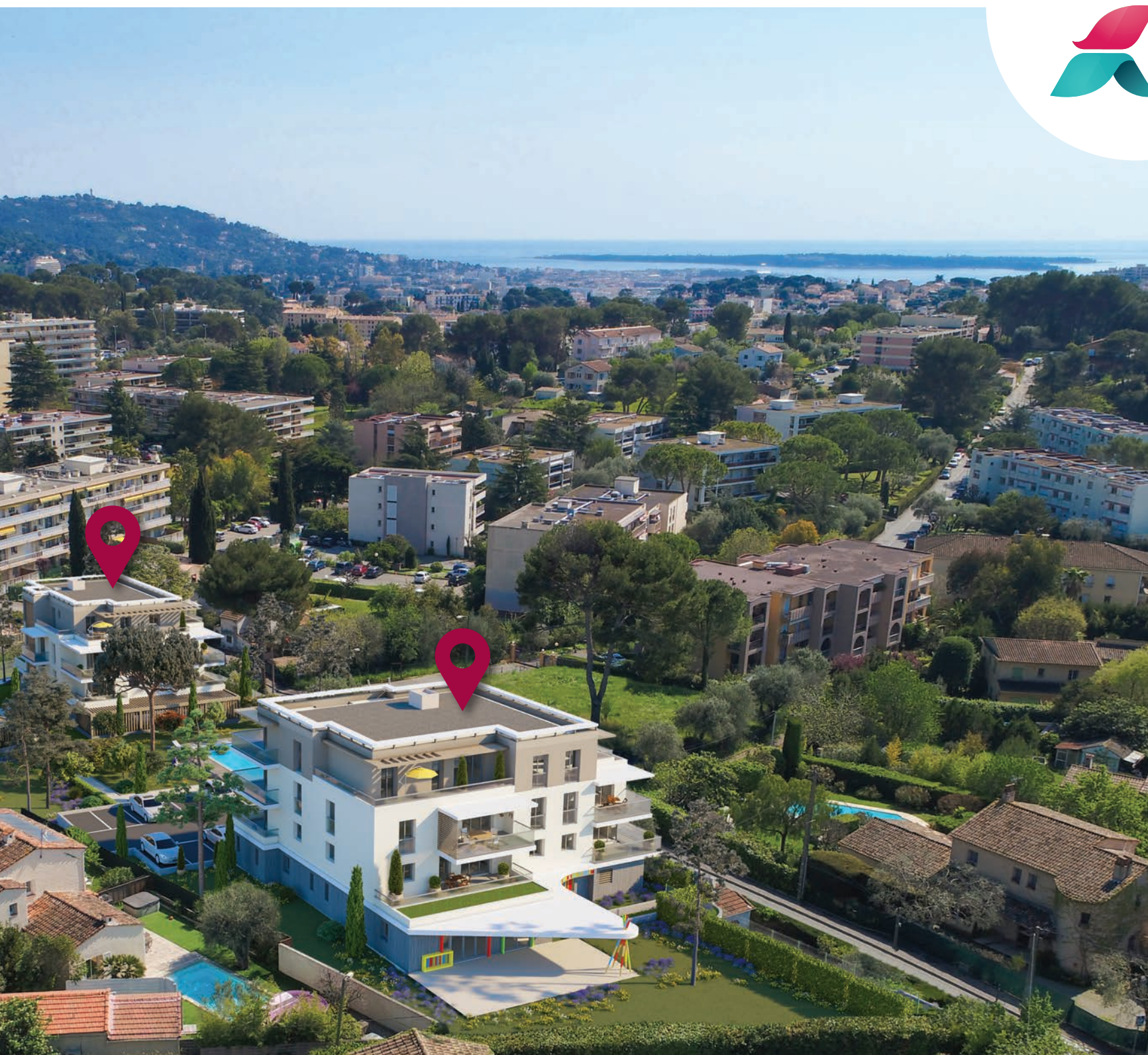
Vue générale de la résidence