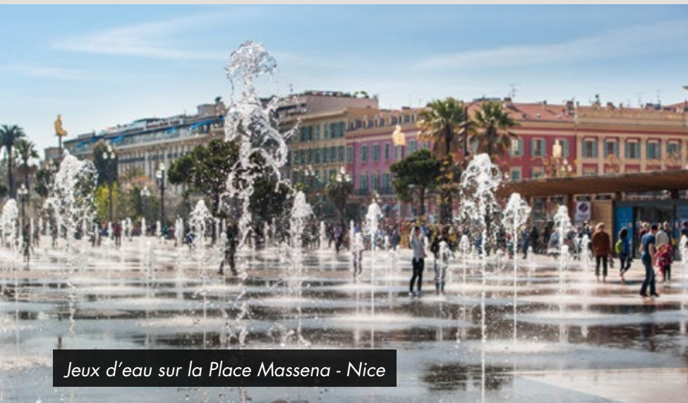
Jeux d'eau sur la Place Masséna - Nice