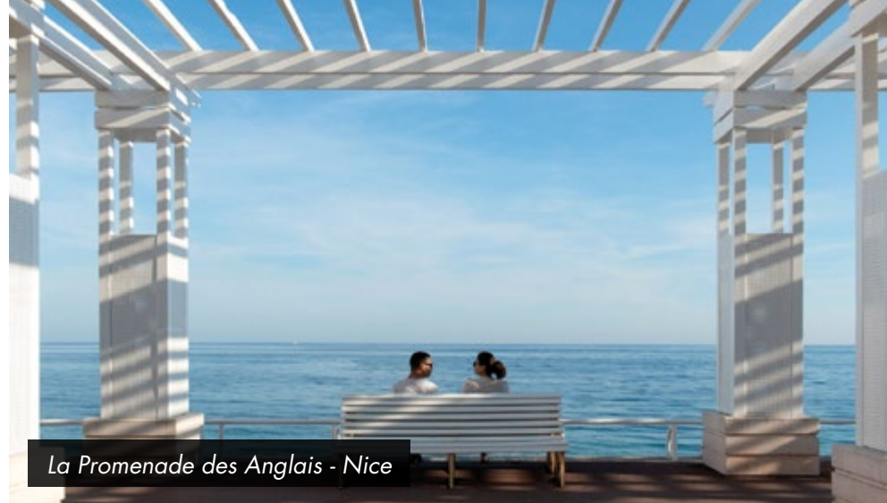
La Promenade des Anglais - Nice