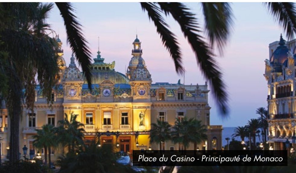
Place du Casino - Principauté de Monaco

Élégante et prestigieuse, Nice séduit et rayonne sur la Côte d'Azur, avec ses ruelles méditerranéennes et son climat exceptionnel imprégné d'une douceur de vivre unique.