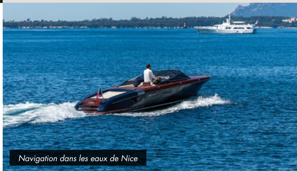
Navigation dans les eaux de Nice